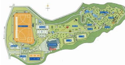
▲トリムパークかなづ